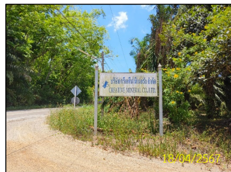
ถนนทางเข้าโครงการ รูปที่ 1-1 ตำแหน่งที่ตั้งโครงการ